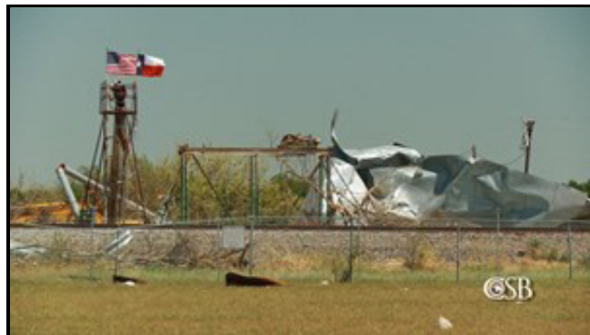
Abbildung 4: Unglücksstelle nach dem Unfall