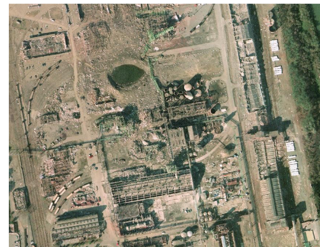
Abbildung 3: Der von der Explosion betroffene Bereich